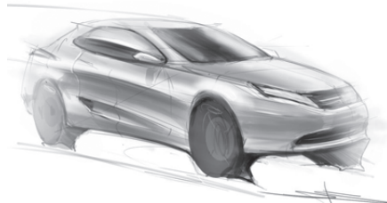
Творча робота В. Карця

— Стають! Немає нічого неможливого, ми — обличчя наших думок.